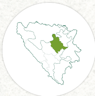
ZENIČKO - DOBOJSKI KANTON