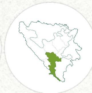
HERCEGOVAČKO- NERETVANSKI KANTON